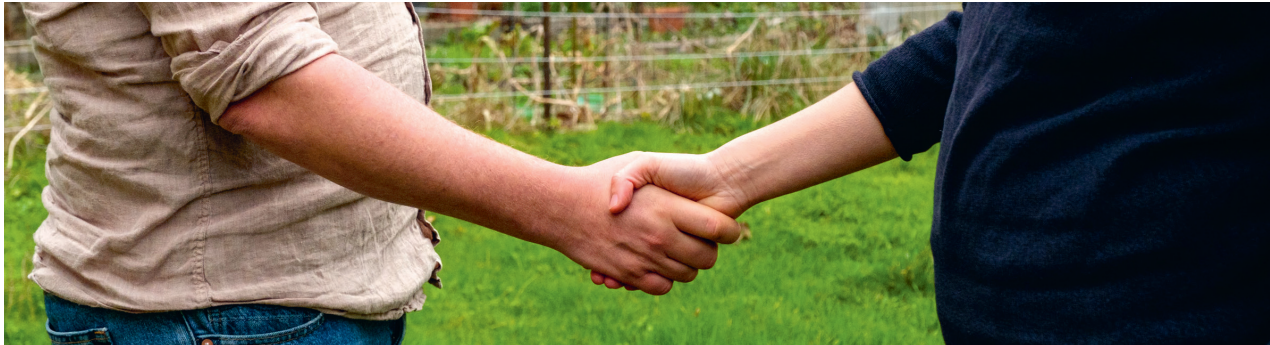
Six fermes ont été vendues ou louées en 2023 grâce au Point de contact pour remise de ferme extra-familiale.

Genève, Neuchâtel et Vaud ainsi que diverses organisations paysannes dont l'Association des petits paysans, représentés par le collectif Avocat-e-s pour le Climat, ont déposé une plainte pour le climat auprès du Département fédéral de l'environnement, du transport, de l'énergie et de la communication. Les autorités sont invitées à prendre toutes les mesures nécessaires pour respecter les engagements internationaux et nationaux de réduction des émissions de gaz à effet de serre.