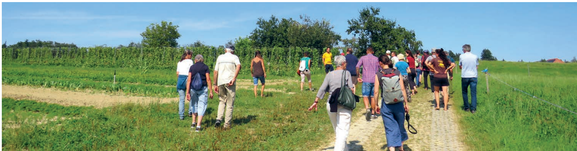
L'Association des petits paysans a invité ses membres à la ferme bio Zaugg en août 2021.

des évènements locaux. En 2022, nous poursuivons l'engagement actif et la mise en réseau avec et entre nos membres.