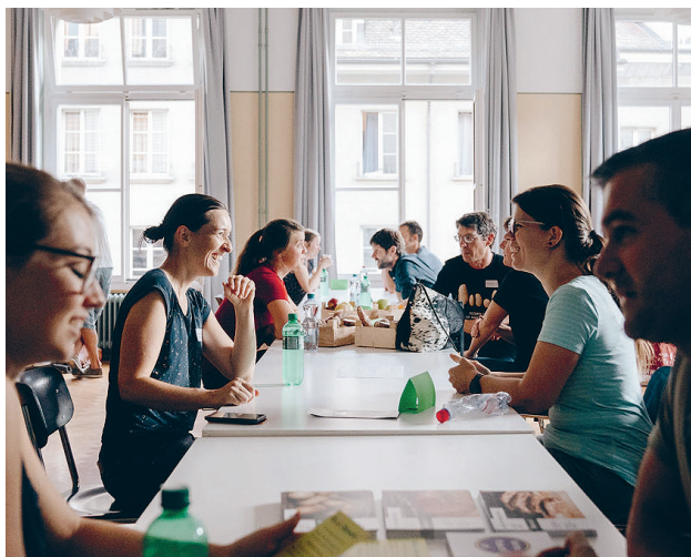
Échange direct sur l'agriculture lors du speed-dating paysan-consommateur

Semaine du goût, soutenu financièrement par la Fondation Albert Koechlin. L'Association des petits paysans l'a organisé en collaboration avec OGG (Ökonomische Gemeinnützige Gesellschaft) Bern le 15 septembre à Berne. Environ 30 producteurs-trices et consommateurs-trices y ont pris part. Les réactions ont toutes été positives. En 2021, le Regio Challenge aura lieu du 13 au 19 septembre.