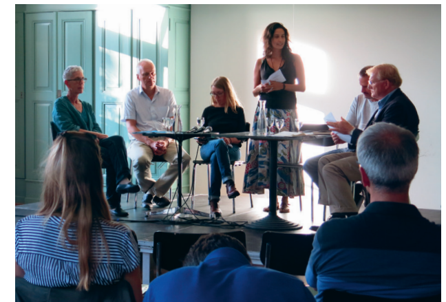
Débat public sur le Regio Challenge « Régional : une chance pour la consommation durable ? »

pouvant être parcourue à vélo. Les objectifs du Challenge étaient d'apprendre à connaître la variété des produits dans la région , de devenir plus sensible à notre comportement alimentaire et à ses impacts, ainsi que d'établir un lien avec le système alimentaire mondial. Nous avons communiqué sur le Challenge principalement en ligne.